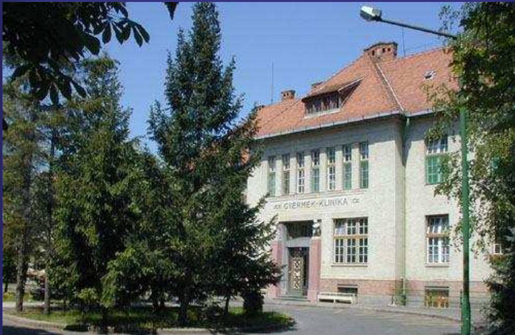
DEOEC Gyermekklinika bejárat