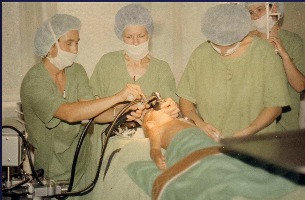
1987. Többen vagyunk