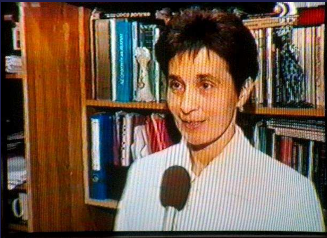
Kongresszus szervezése közben