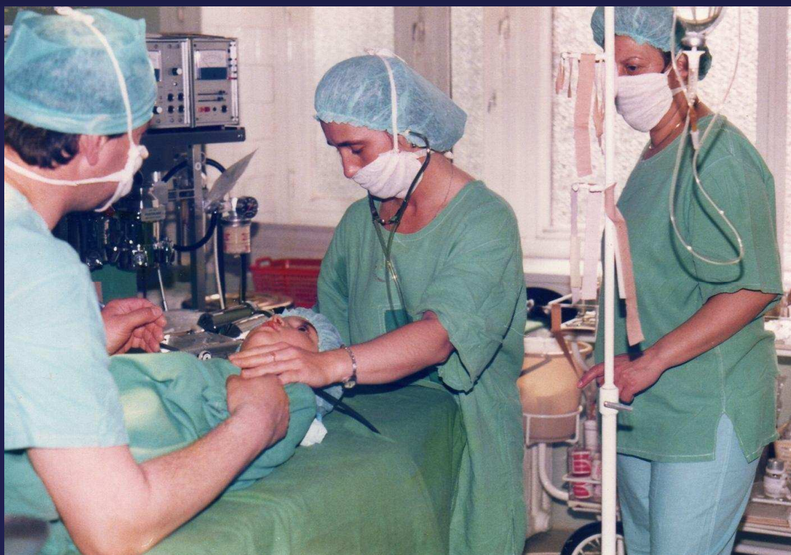
1986. Segítségem: a műtősnőnk és a műtősfő