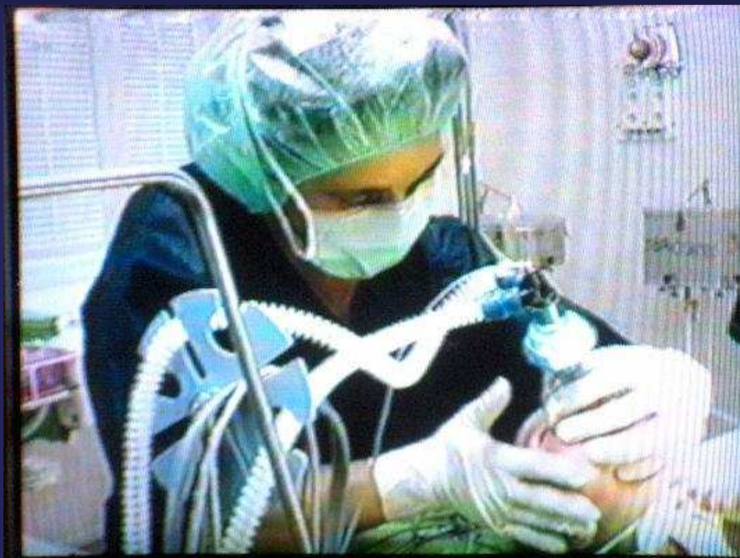
Néhány kép a „jobb időkből” (jó műszerezettséggel)