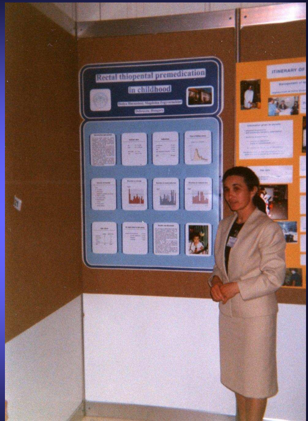
1996. IV. Nemzetközi szakdolgozói kongresszus, Bécs