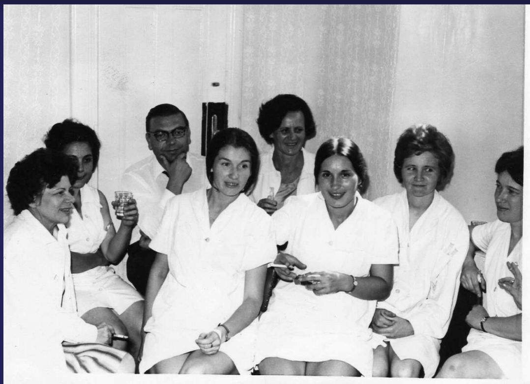
1972. Kollégák körében