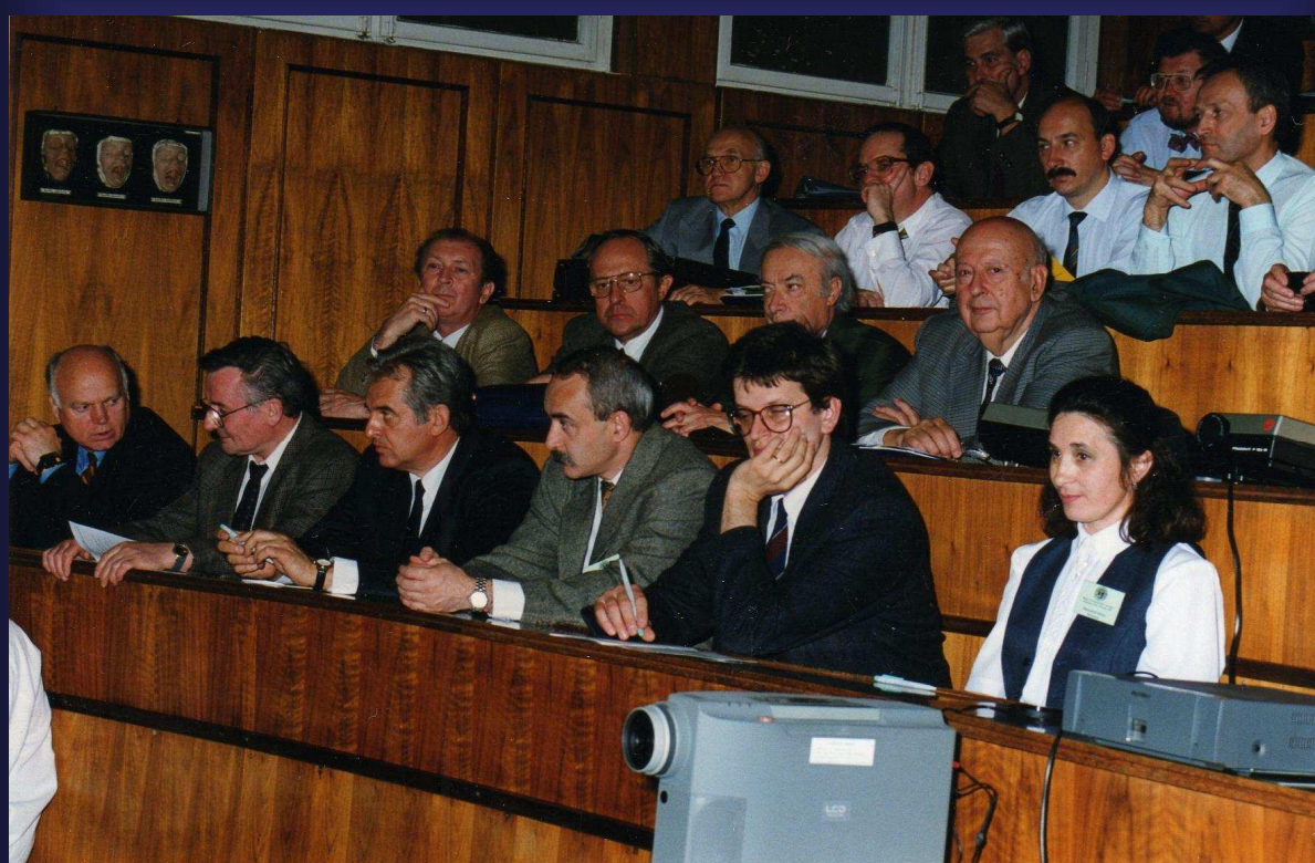
A közönség soraiban